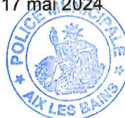
Le Maire d'Aix-les-Bains Renaud BERETTI